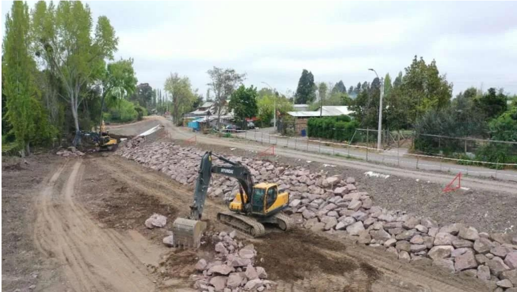
Defensas fluviales El Tambo, comuna de Santa Cruz