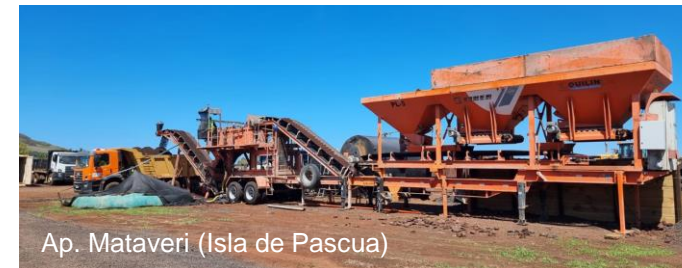
Ap. Mataverí (Isla de Pascua)

Menor volumen de áridos nuevos (hasta -76%)