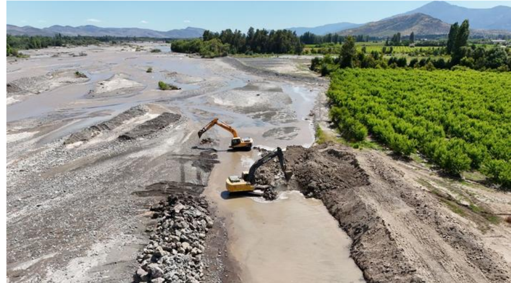
Defensas fluviales, comuna de Doñihue