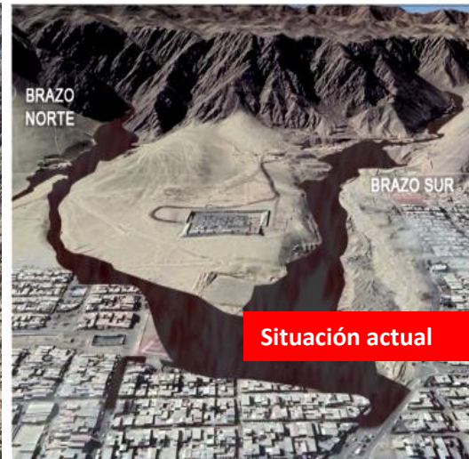
Obras de control aluvional en Quebrada Bonilla Región Antofagasta