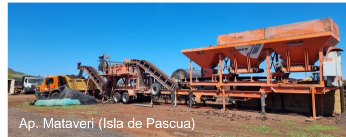
Ap. Mataverí (Isla de Pascua)

Menor volumen de áridos nuevos (hasta -76%)