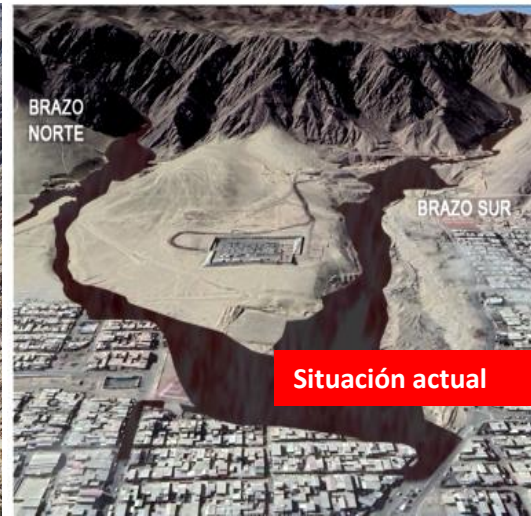
Obras de control aluvional en Quebrada Bonilla Región Antofagasta