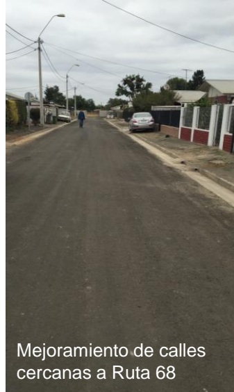
Mejoramiento de calles cercanas a Ruta 68