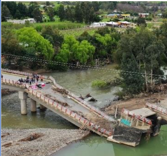
Reposición de puente Maitenhuapi Región del Maule

Adecuar los servicios que presta la infraestructura y edificación pública a los impactos del cambio climático, para que sean resilientes al clima actual y futuro.