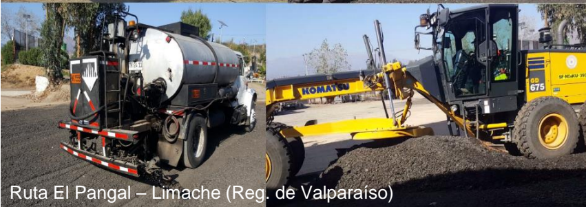
Ruta El Pangal – Limache (Reg. de Valparaíso)