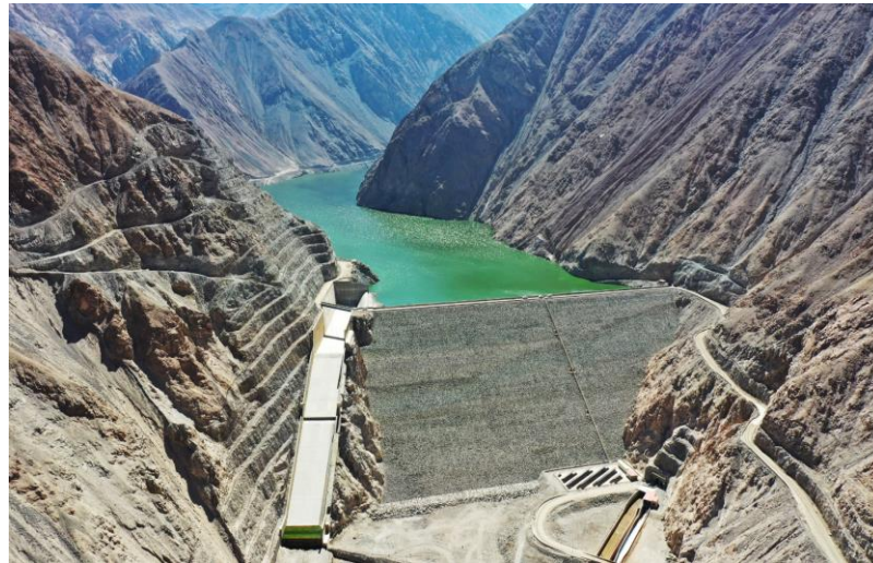
Embalse Chironta Región de Arica y Parinacota