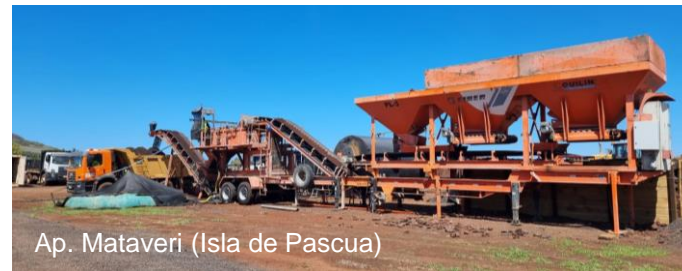
Ap. Mataverí (Isla de Pascua)

Menor volumen de áridos nuevos (hasta -76%)